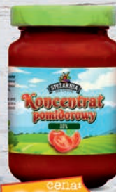
Koncentrat pomidorowy 190 ml