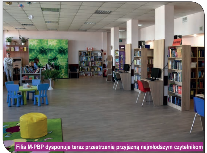
Filia M-PBP dysponuje teraz przestrzenią przyjazną najmłodszym czytelnikom