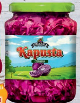
Kapusta czerwona 650 g

Zdjęcia prezentowane są poglądowo i mogą różnić się od rzeczywistych produktów dostępnych w sklepie.