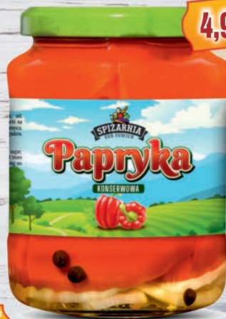
Papryka konserwowa 720 ml