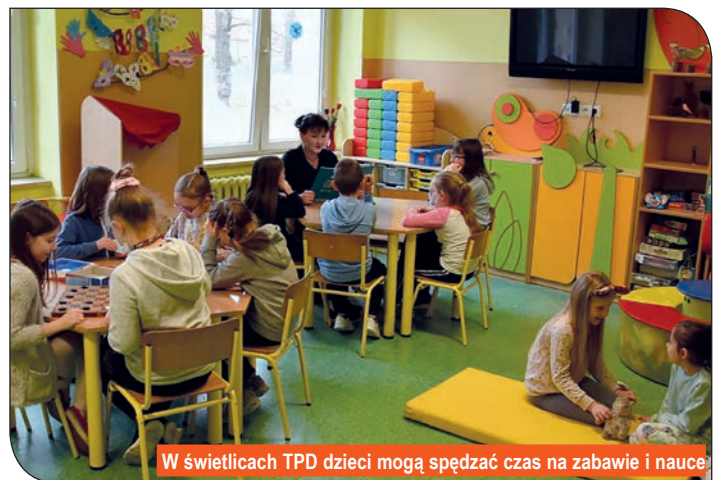
W świetlicach TPD dzieci mogą spędzać czas na zabawie i nauce