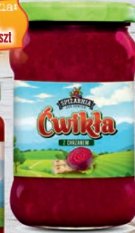
Cwikła z chrzanem 315 ml