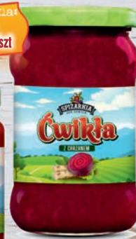
Cwikła z chrzanem 315 ml