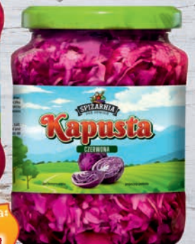
Kapusta czerwona 650 g

Zdjęcia prezentowane są poglądowo i mogą różnić się od rzeczywistych produktów dostępnych w sklepie.