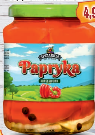
Papryka konserwowa 720 ml