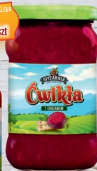
Ćwikła z chrzanem 315 ml