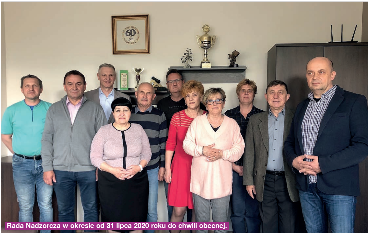
Rada Nadzorcza w okresie od 31 lipca 2020 roku do chwili obecnej.