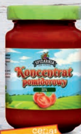
Koncentrat pomidorowy 190 ml