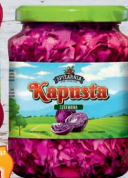
Kapusta czerwona 650 g

Zdjęcia prezentowane są poglądowo i mogą różnić się od rzeczywistych produktów dostępnych w sklepie.