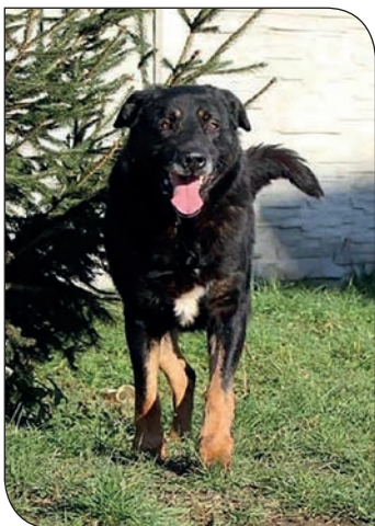
Baca - ok. 10 lat

Baca to duży i bardzo sympatyczny pies łaknący uwagi człowieka i spacerów.