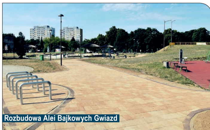
Rozbudowa Alei Bajkowych Gwiazd