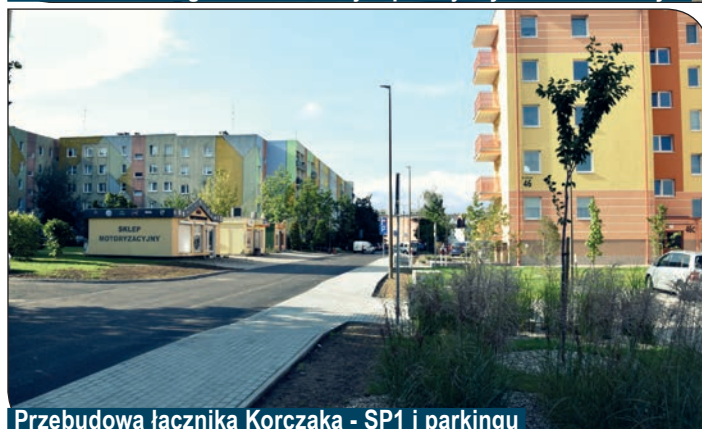
Przebudowa łącznika Korczaka - SP1 i parkingu