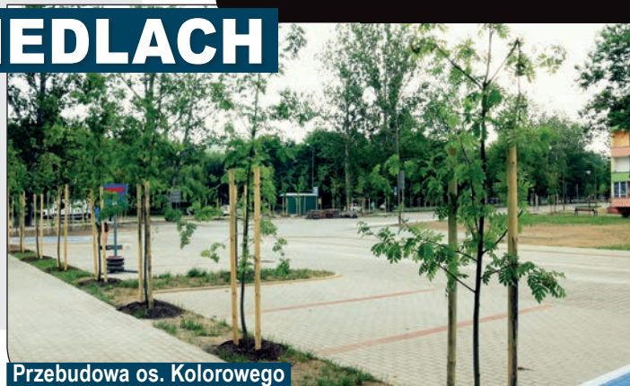
Przebudowa os. Kolorowego

Rozbudowa Alei Bajkowych Gwiazd – to dopełnienie wykonanych wcześniej prac. Nowy chodnik połączy istniejącą aleję z wyjściem od strony os. Różanego. Zamontowano także oświetlenie, ławki, kosze i stojaki na rowery oraz dosadzono 15 drzew.