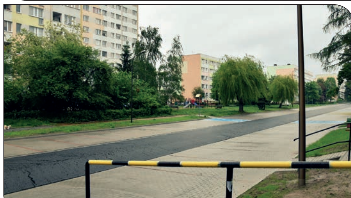
Przebudowa drogi i budowa miejsc postojowych na os. Jasnym