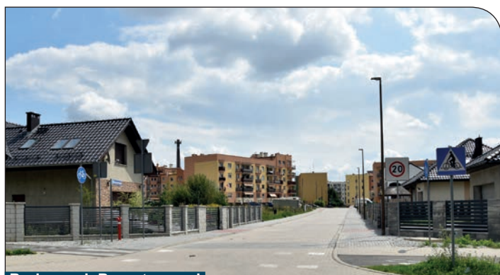
Budowa ul. Bursztynowej