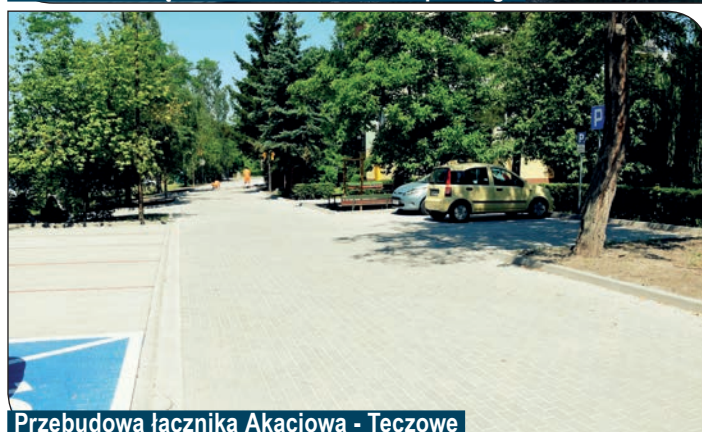
Przebudowa łącznika Akacyjna - Tęczowe